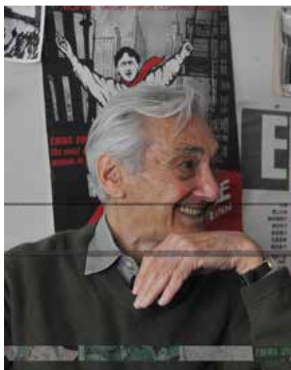
L'historien et universitaire Howard Zinn, né le 24 août 1922 à New York, et mort le 27 janvier 2010 à Santa Monica, en Californie. Auteur de « Une histoire populaire des Etats-Unis », une œuvre et un homme à combattre selon Trump.

Le RN se prétend le défenseur des ouvriers, des populations délaissées, mais se rapproche