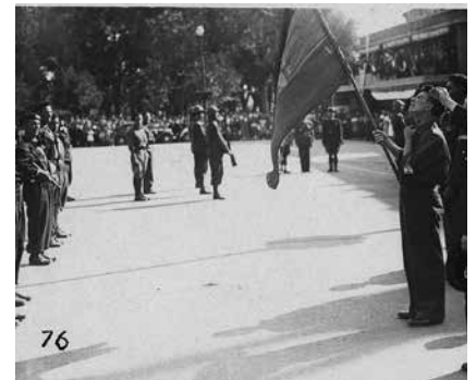
Albi, place du Vigan, 12 septembre 1944. Présentation du drapeau de l'Espagne républicaine par des membres de l'U.N.E. (Union nationale espagnole) pour son action dans la Résistance contre l'occupant nazi à Albi et dans le Tarn.

Lors du congrès de l'UD CGT du Tarn, le 4 janvier 1945, la question des EGRF est abordée : « Le plus important, préparer pour les États Généraux de la Renaissance Française les cahiers de doléances de leur entreprise qui se fondront avec celui de leur industrie. C'est par les États Généraux de la Renaissance Française que nous construirons une démocratie, sinon parfaite, du moins libérée de l'exploitation financière et industrielle. »... Le « FN : journal du Front national de la Résistance » consacre douze articles dans les